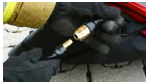
Druckluft-Kupplung; weiblich für Schlauchdurchmesser 9mm; Nennweite 7,2mm