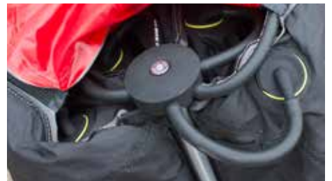
One-Pump System, dadurch gleichmäßige Luftverteilung auf alle 4 Säulen

BERATUNG UND KAUF: +49 (0) 89 744 190 38 / info@perfect-cover.de