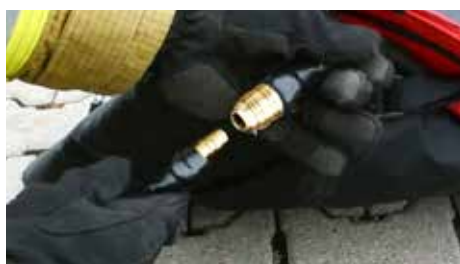
Druckluft-Kupplung: weiblich für Schlauchdurchmesser 9mm; Nennweite 7,2mm

BITTE BEACHTEN: Eine 6-Liter-Druckluftflasche mit 300 Bar wird beim Befüllen der Zeltschläuche vollständig entleert. Die Flasche sollte daher nicht mehr für Atemgas verwendet werden.