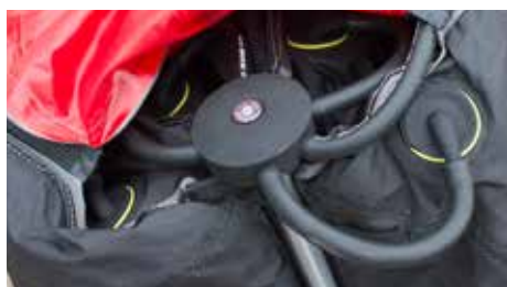
One-Pump System, dadurch gleichmäßige Luftverteilung auf alle 4 Säulen