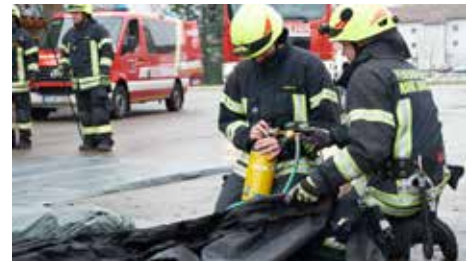
Aufbau in ca. 2 Minuten (bei 10 Bar Druck)

BITTE BEACHTEN: Eine 6-Liter-Druckluftflasche mit 300 Bar wird beim Befüllen der Zeltschläuche vollständig entleert. Die Flasche darf daher nicht mehr für Atemgas verwendet werden.